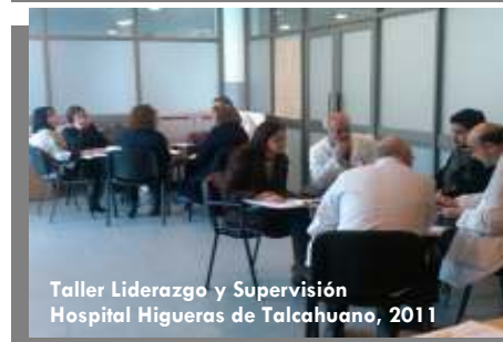
Taller Liderazgo y Supervisión Hospital Higuera de Talcahuano, 2011