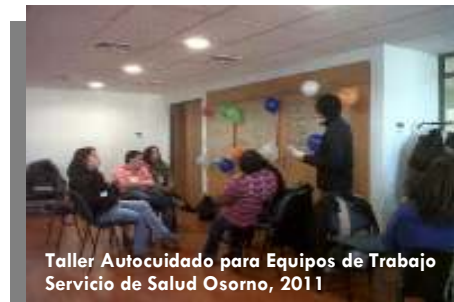
Taller Autocuidado para Equipos de Trabajo Servicio de Salud Osorno, 2011