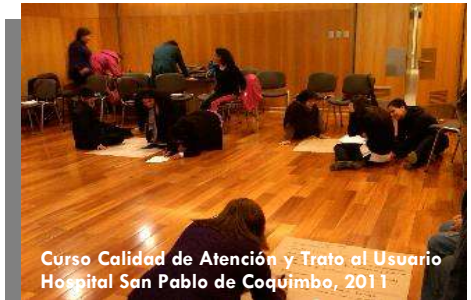
Curso Calidad de Atención y Trato al Usuario Hospital San Pablo de Coquimbo, 2011