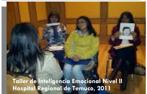
Taller de Inteligencia Emocional Nivel II Hospital Regional de Temuco, 2011