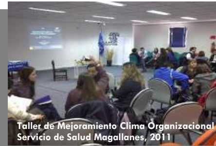
Taller de Mejoramiento Clima Organizacional Servicio de Salud Magallanes, 2011