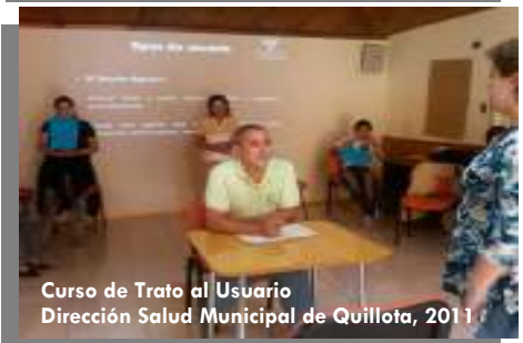
Curso de Trato al Usuario Dirección Salud Municipal de Quillota, 2011